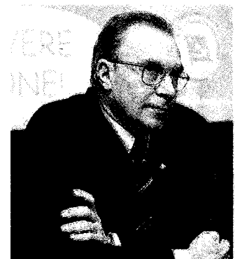
Guglielmo Epifani, leader Cgil